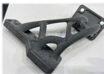
[使用例] 最終製品(機械部品)