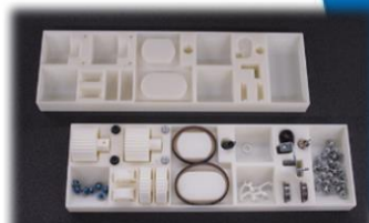
[使用例] 部品配膳トレー