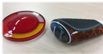
[使用例] 設計・試作工程